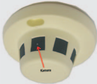
Verdeckte Kamera im Bewegungsmelder oder Rauchmelder