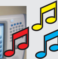
Mini-Touch-Kasse oder als Mp3-Musik-Jukebox